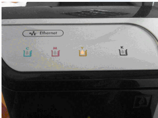
Im Beispiel wurde die gelbe Patrone ersetzt

Lediglich die Patronenwarnleuchte am Drucker wird Ihnen durch "Aufleuchten" anzeigen das die Patrone ersetzt wurde. Dies wird den Druck jedoch nicht beeinflussen.